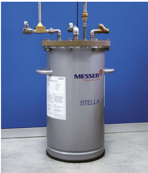
Der Unterkühler erhöht die Kältequalität des Stickstoffs.