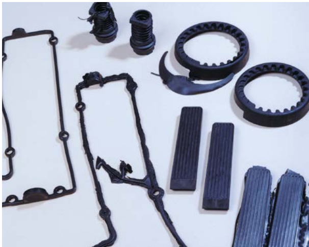
Gummitteile vor und nach der Entgratung